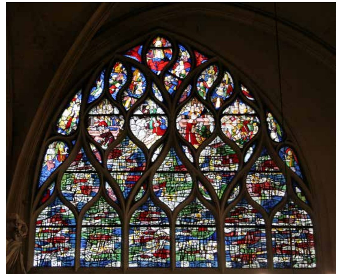
Anne Le Chevallier, baie du pourtour du chœur de l'église Saint-Gervais-Saint-Protais, Paris, 1976, 3,8 x 5,5 m. © ADAGP, Paris, 2025, phot. A. Cloup.