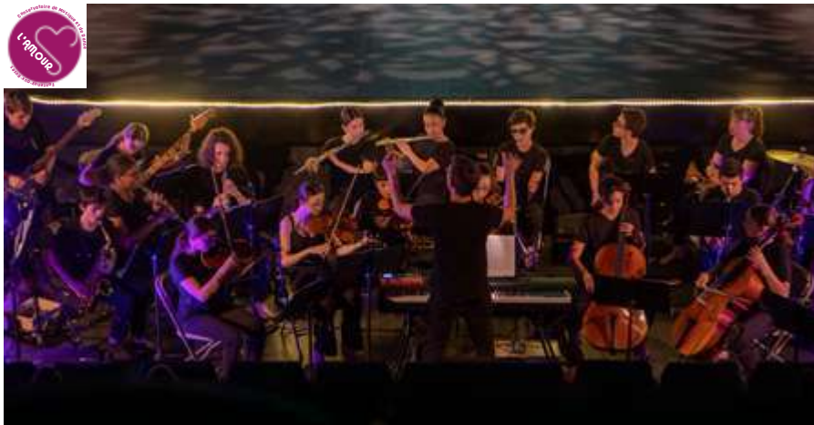
Concert des classes CHAM