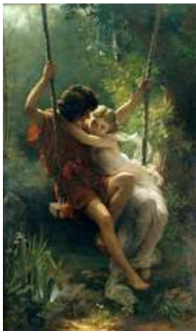
Le printemps - Pierre Auguste Cot