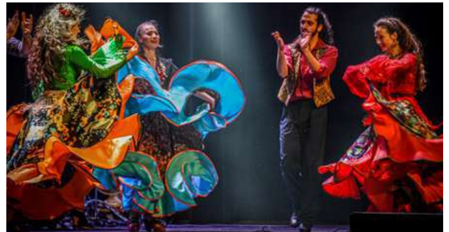
Spectacle de danses tziganes