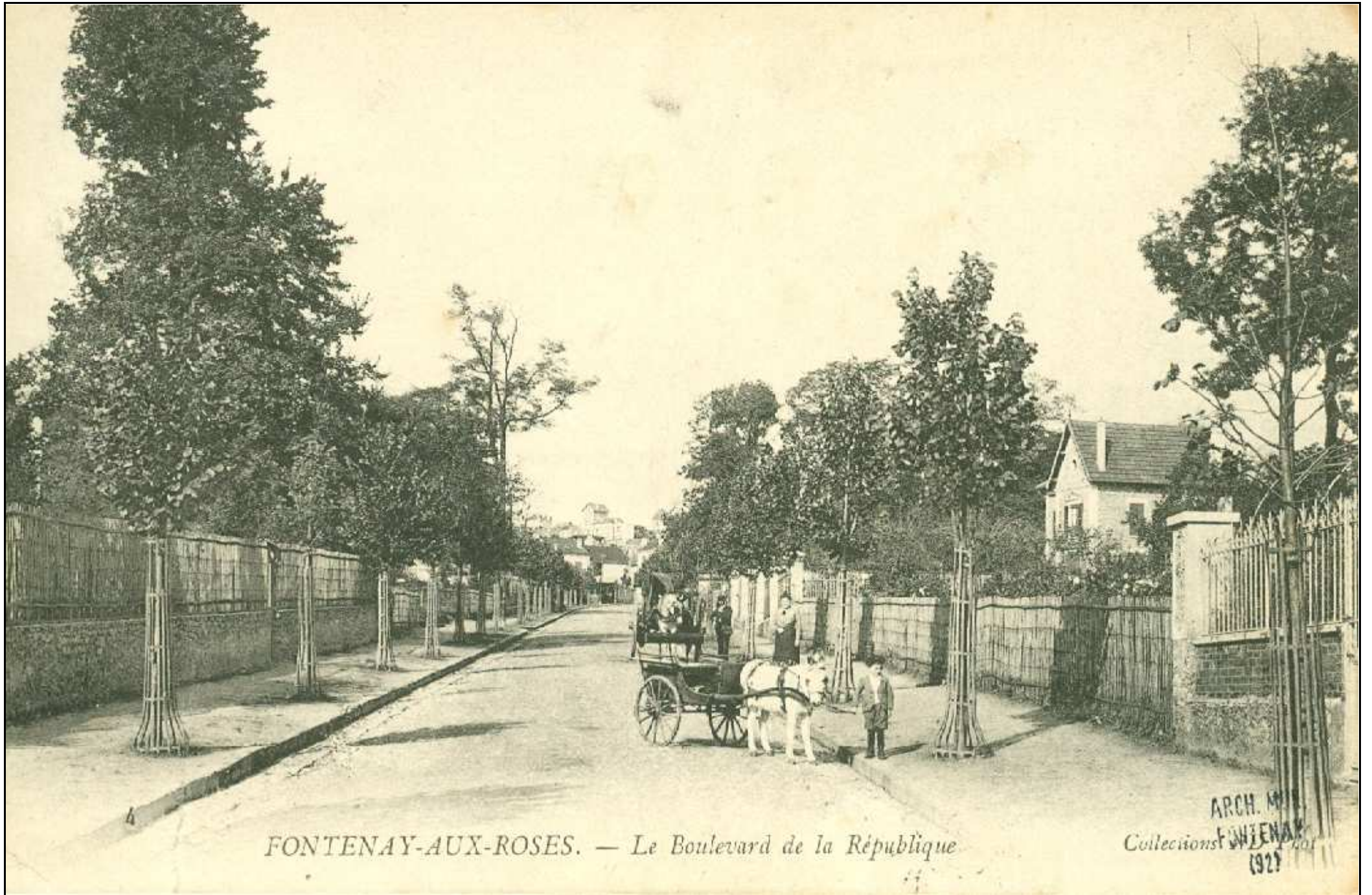
FONTENAY-AUX-ROSES. — Le Boulevard de la République