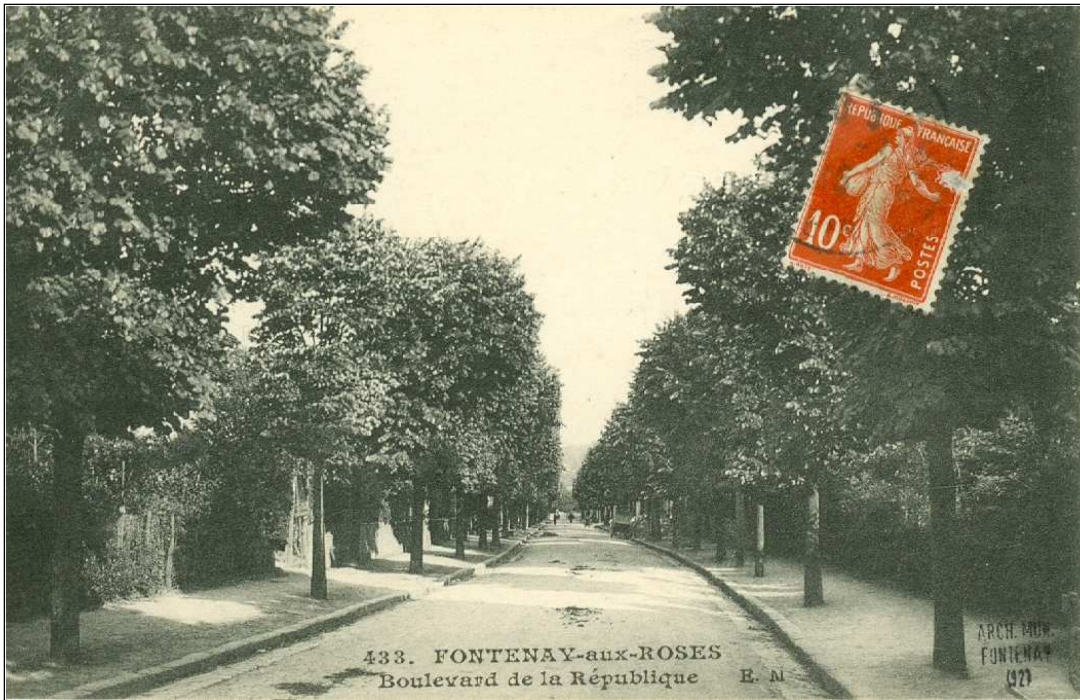
433. FONTENAY-aux-ROSES Boulevard de la République