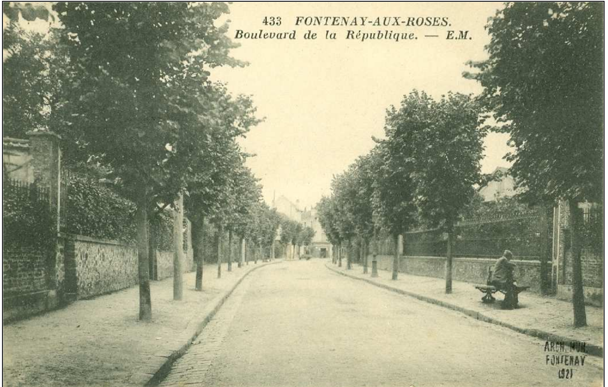
433 FONTENAY-AUX-ROSES. Boulevard de la République. — E.M.