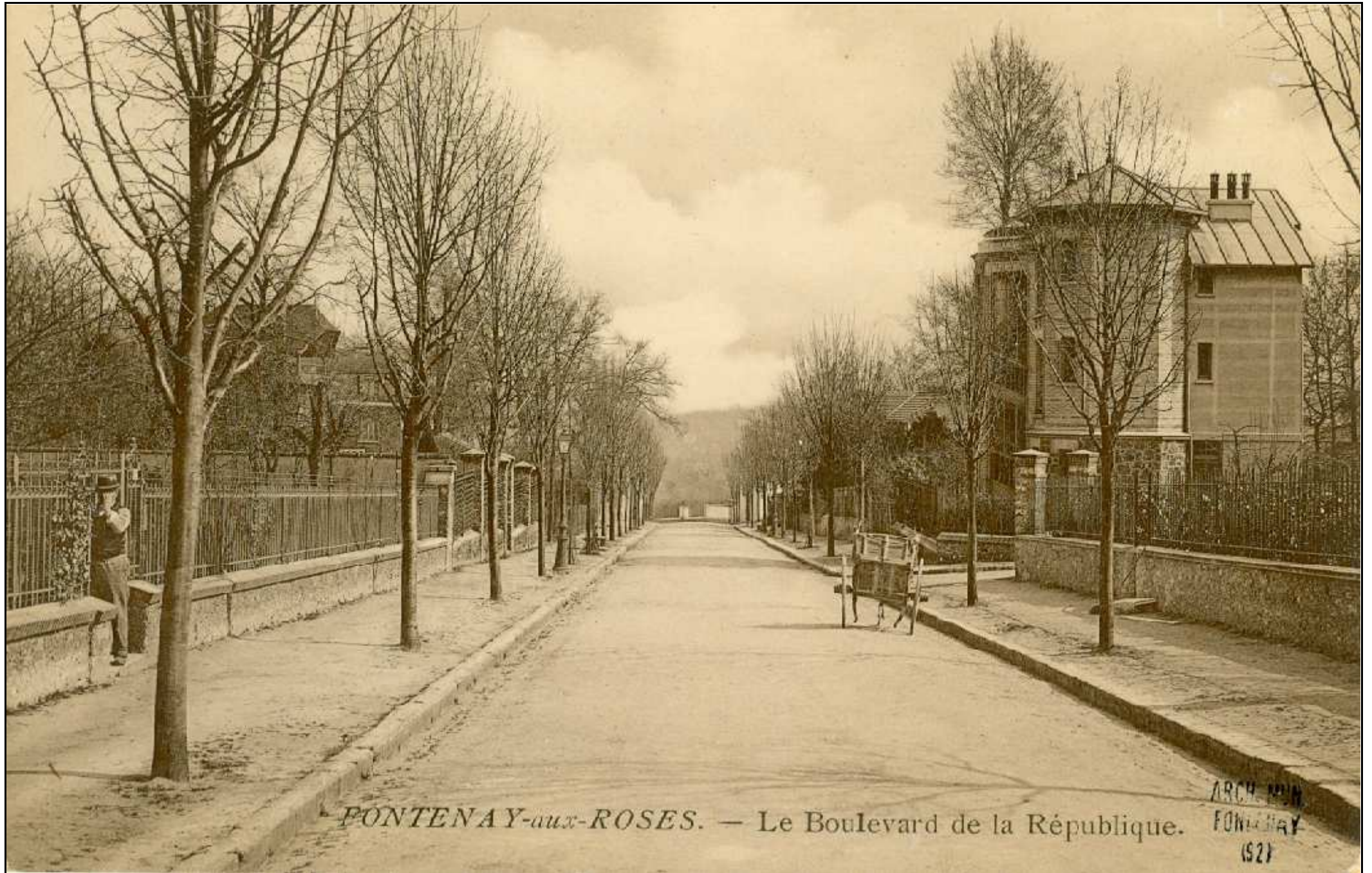
PONTENAY-aux-ROSES. — Le Boulevard de la République.