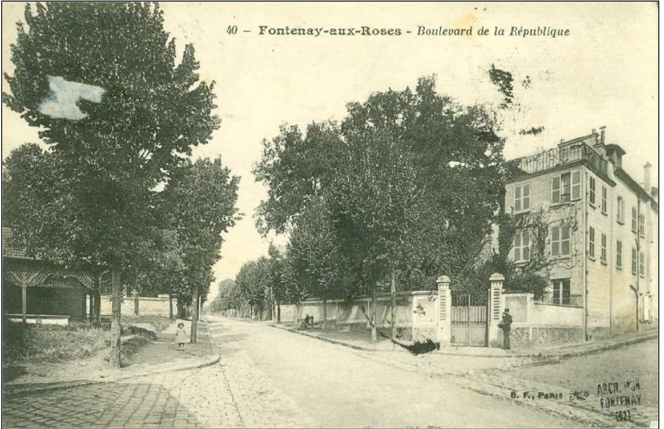
40 - Fontenay-aux-Roses - Boulevard de la République