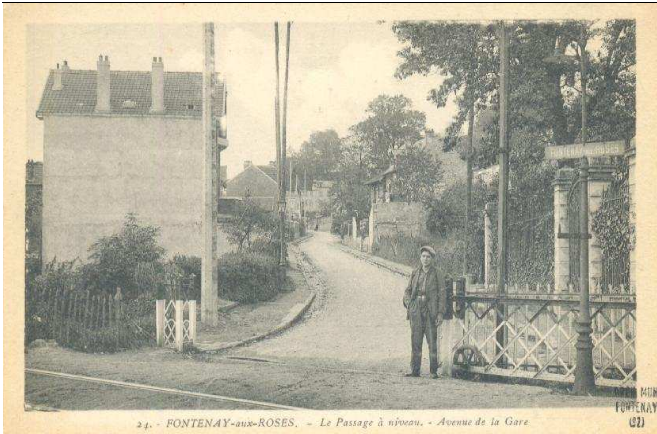
24. - FONTENAY-aux-ROSES. - Le Passage à niveau. - Avenue de la Gare.

5 Fi GARE 401 [au début des années 1930; dans le fond, l'actuelle rue Robert Marchand]