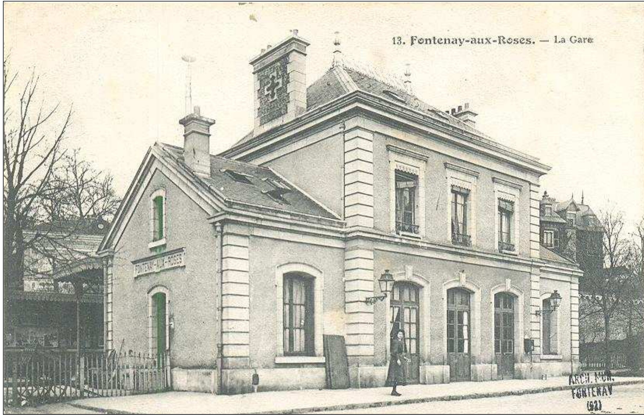
13. Fontenay-aux-Roses. — La Gare