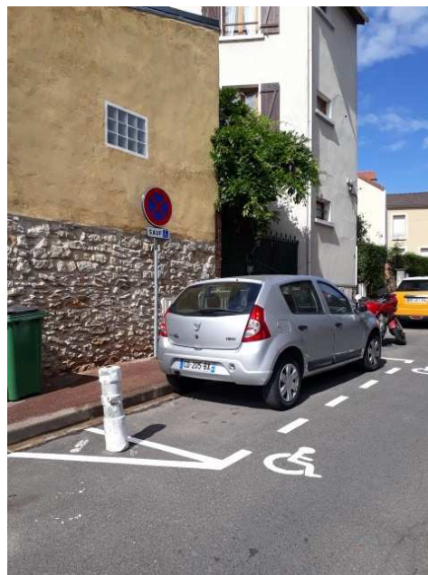
Au 27 rue André Salel