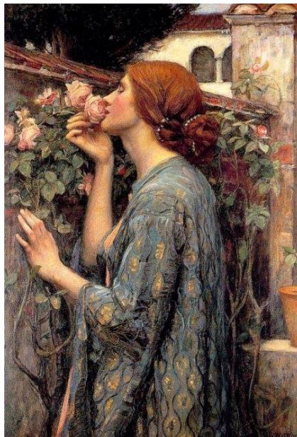
The Soul of the Rose - John William

Nous sommes amenés dans les jours et les semaines qui suivent à respecter un certain nombre de mesures et de protocoles dans le but de garantir la bonne santé de tous. Nous allons sûrement être traversés par différents sentiments : l'incertitude, l'angoisse, peut-être la colère. Il est donc important de se préparer à cette vague d'émotions en adoptant un regard neuf face à cet environnement de vie pour le moins différent.