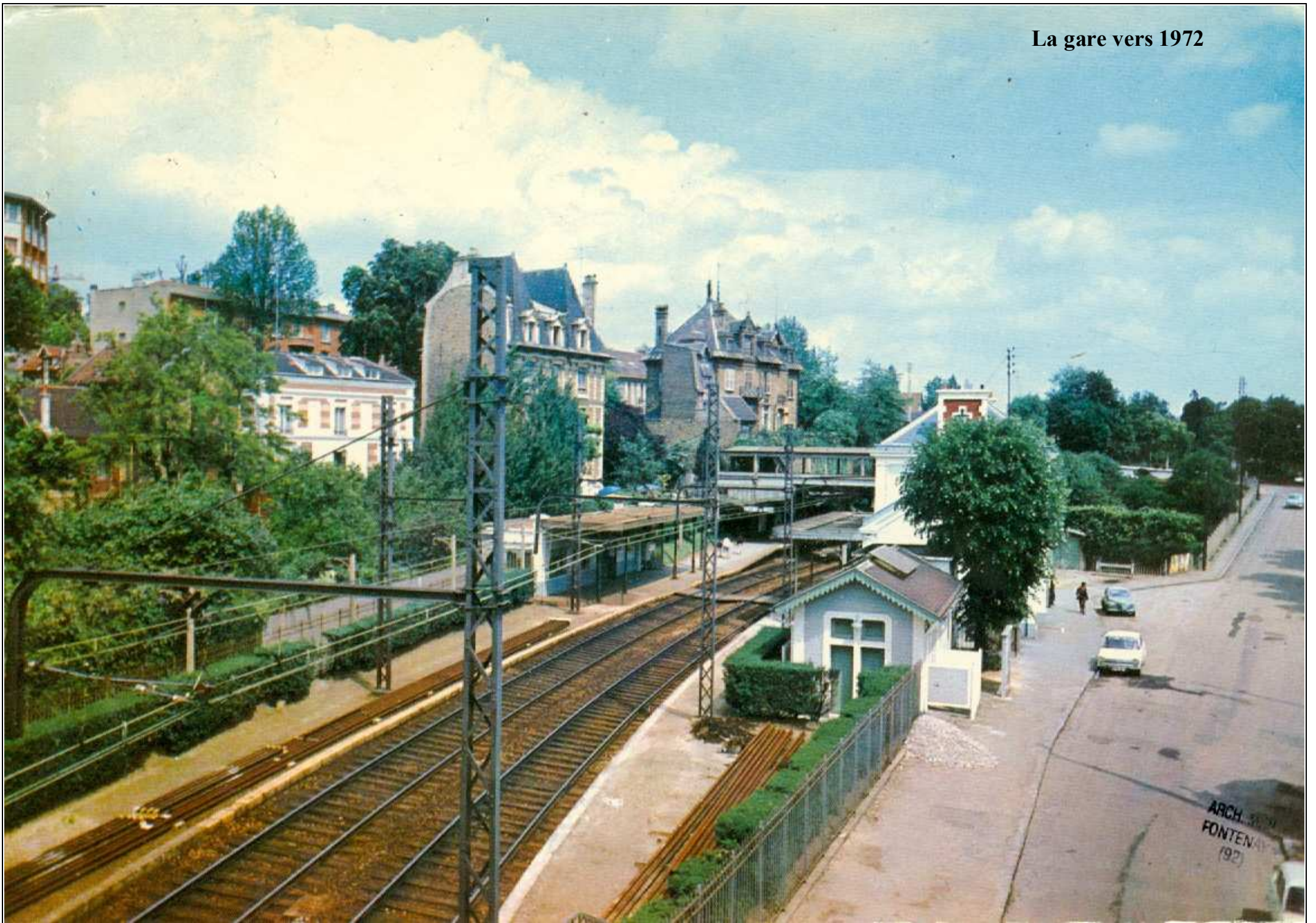
La gare vers 1972