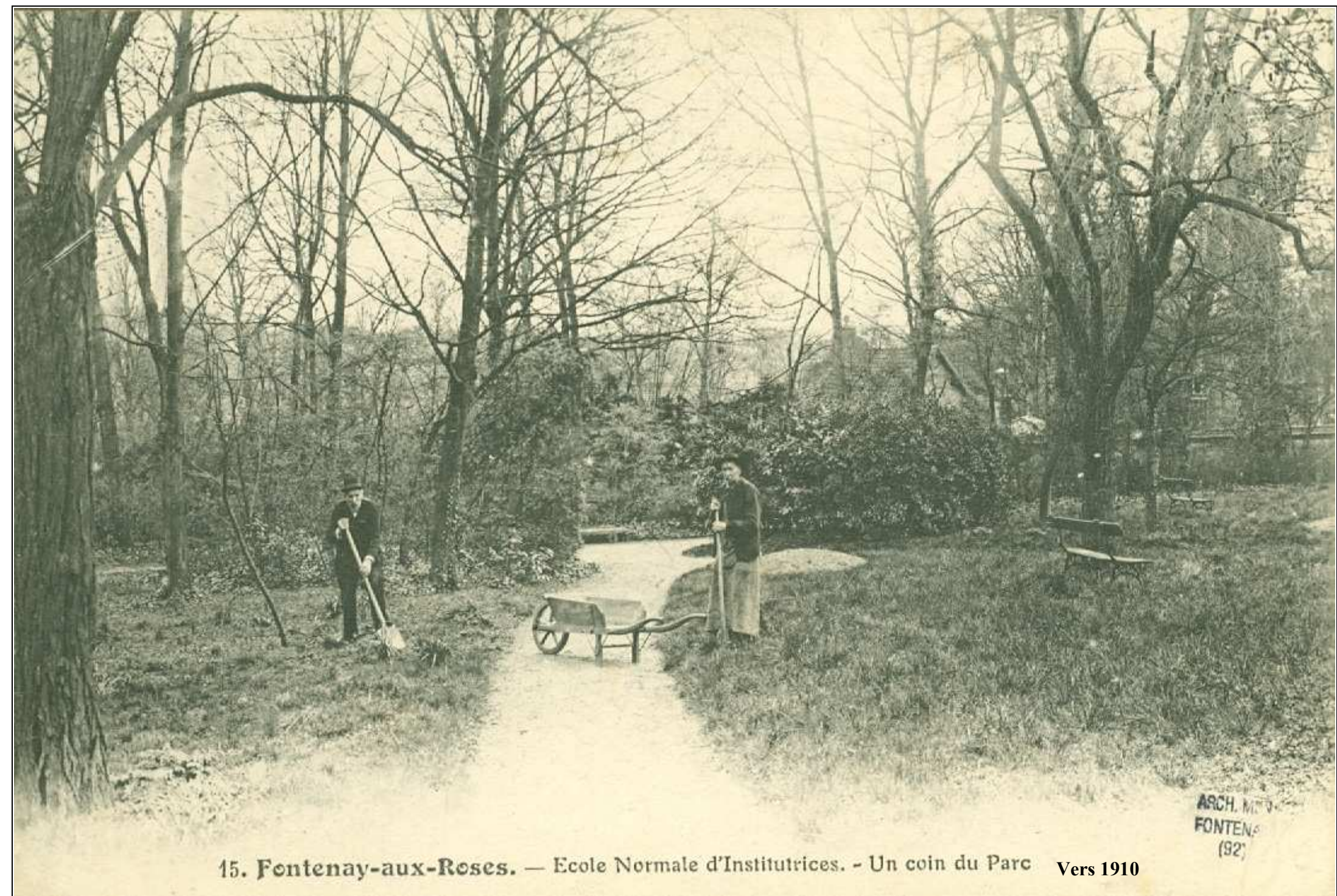
15. Fontenay-aux-Roses. — Ecole Normale d'Institutrices. - Un coin du Parc Vers 1910