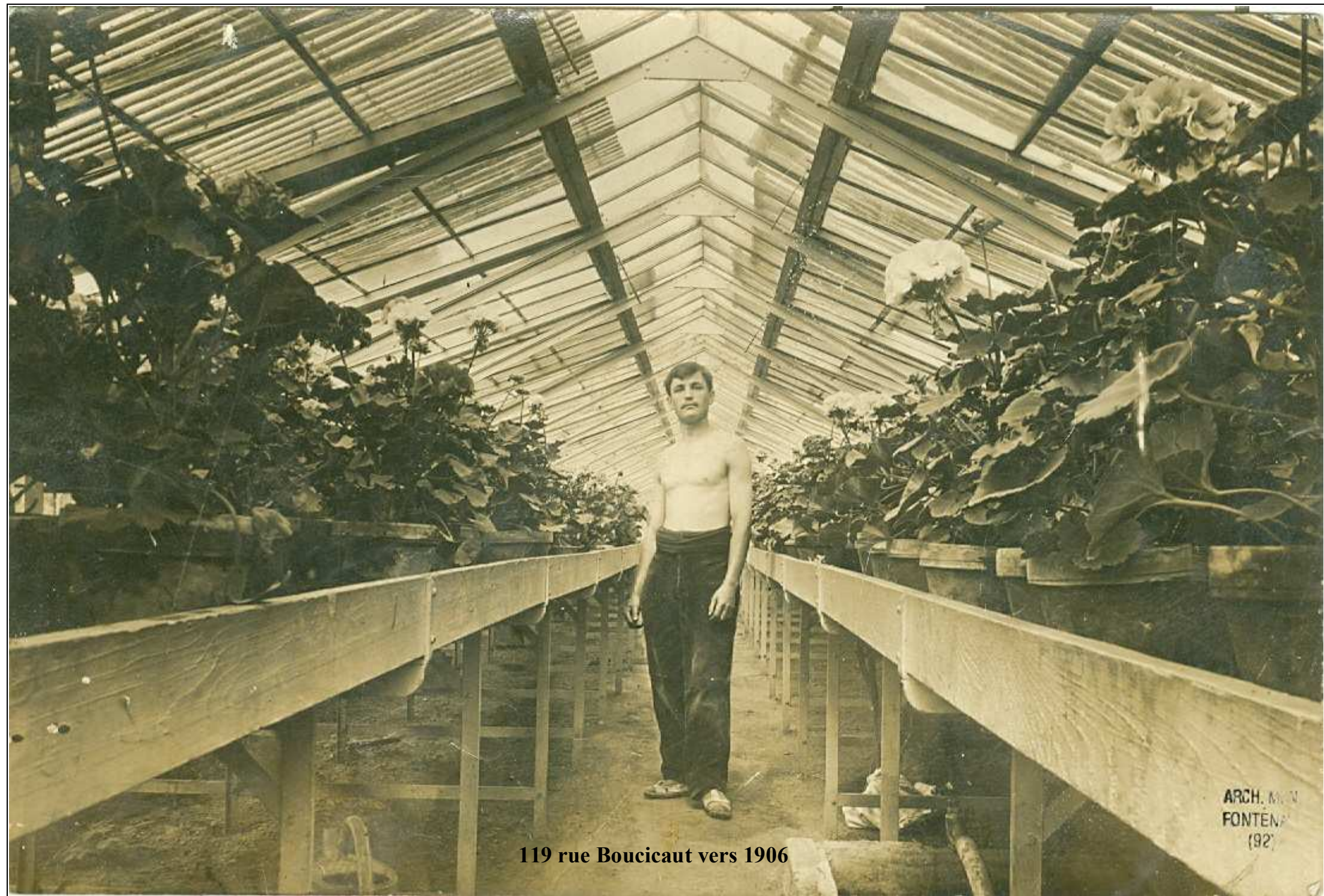
119 rue Boucicaut vers 1906