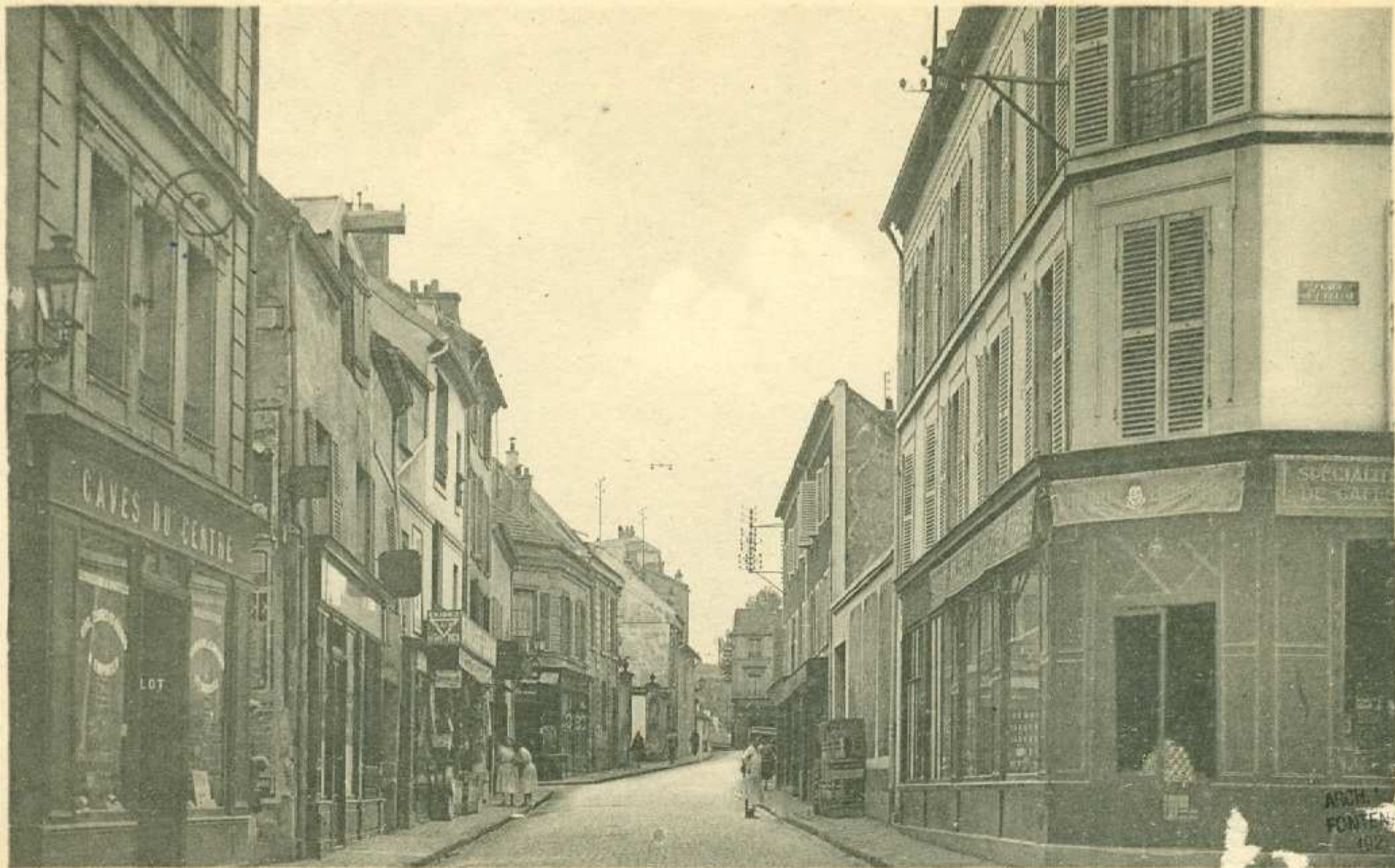
27. - FONTENAY-aux-ROSES. — Rue Boucicaut. Années 1920