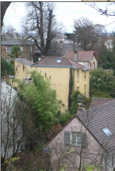
Photo de M. Gérard Tison depuis la rue Jean-Longuet (décembre 2018).