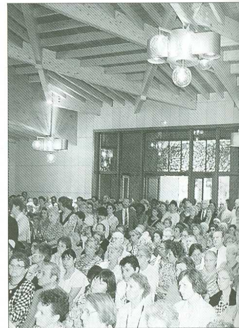
La chapelle était co

La nouvelle chapelle, rue Gentil-Bernard, app Pendant la cérémonie, l'architecte et le maître Cette chapelle porte le nom de Sainte-