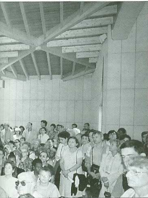
e pour l'inauguration

nant à la Communauté des Oblats de la Vierge Marie a été inaugurée en juillet. rrier ont expliqué la conception volontairement moderne de cette construction. universellement connue pour sa passion et sa dévotion envers le Christ.