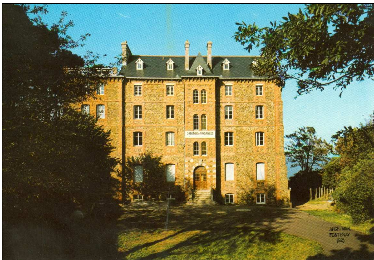
Documents AM FaR : Affiche de 1966 (2R112), couverture du journal de la colonie en 1956, carte postale des années 1970.