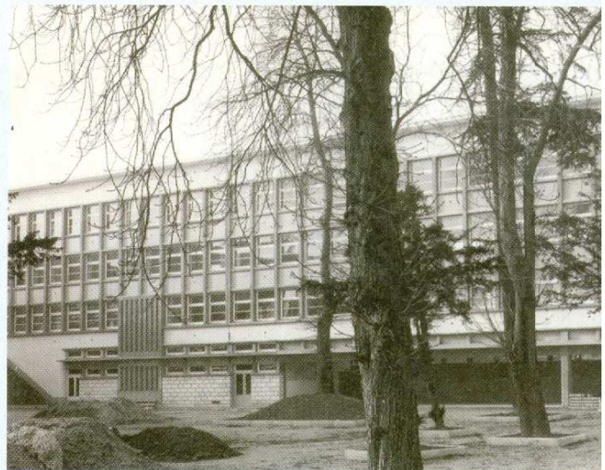
Pendant les travaux, de nombreux arbres ont été sauvegardés (vers 1965).

Lors du premier jour de rentrée, le 19 septembre 1966, les 600 collégiens n'empruntent pas encore l'escalier principal donnant sur la rue des Ormeaux. En effet, il n'est pas encore construit. Pour des raisons techniques et financières, cet équipement ne sera achevé qu'en cours d'année, retardant d'autant l'inauguration officielle du collège. Celle-ci aura lieu le 3 juin 1967 en présence notamment du