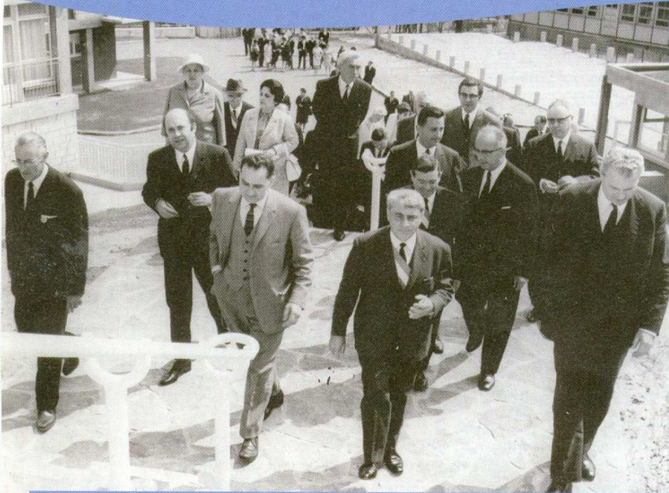
L'inauguration du collège le 3 juin 1967. On reconnaît notamment le maire de Fontenay de l'époque, Maurice Dolivet, et, à sa gauche, le Préfet des Hauts-de-Seine, Claude Boitel.