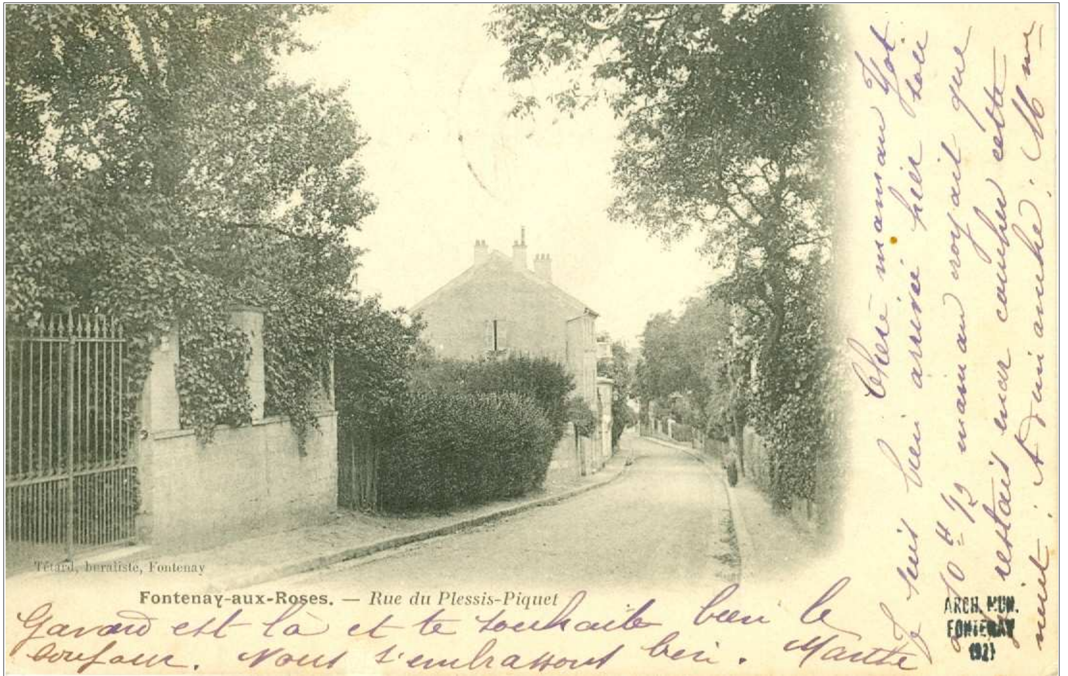
Tétard, buraliste, Fontenay

Fontenay-aux-Roses. — Rue du Plessis-Piquet