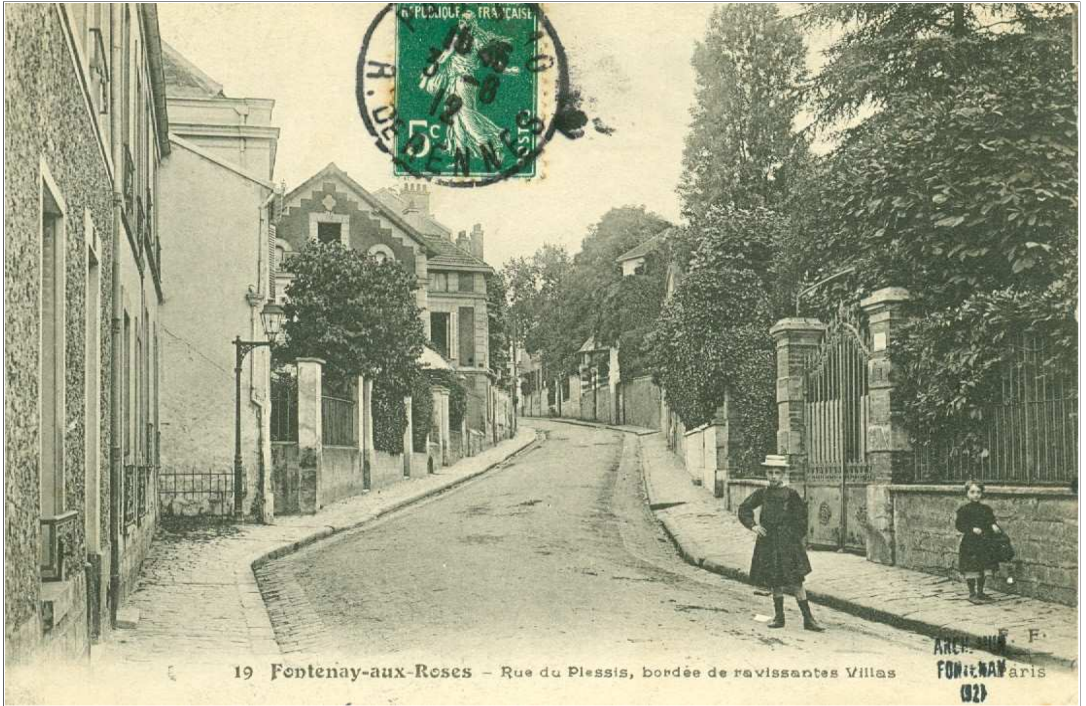
19 Fontenay-aux-Roses - Rue du Plessis, bordée de ravissantes Villas