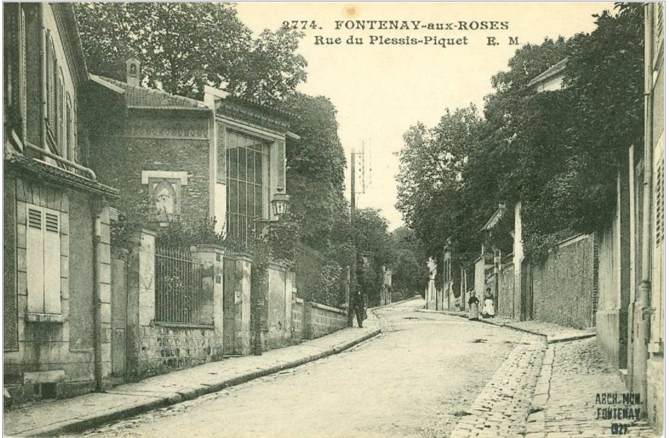
2774. FONTENAY-aux-ROSES Rue du Plessis-Piquet E. M.