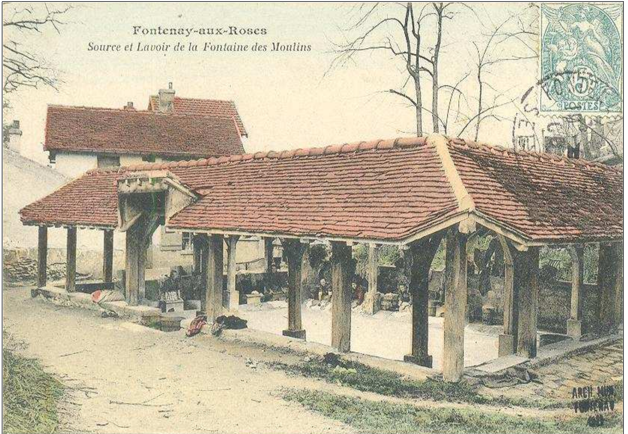
Fontenay-aux-Roses Source et Lavoir de la Fontaine des Moulins