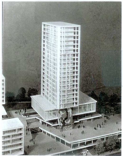
Le projet immeuble tour (années 1960)

l'édifice exigu 8 . Dès les années 1930, des projets d'agrandissement sont envisagés. Parmi ceux-ci, le programme le plus ambitieux est présenté dans les années 1964-1965 : un immeuble-tour d'une quinzaine d'étages devait remplacer la mairie actuelle. La partie inférieure devait être réservée à l'administration tandis que les étages feraient office d'appartement d'habitation. Un marché couvert et un parking devaient compléter l'ensemble. Les problèmes juridiques soulevés par la cohabitation entre le domaine public et le domaine privé 9 ainsi que la durée des travaux (estimée à 36 mois) feront échouer le projet.