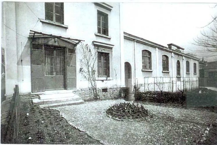
Le centre administratif (état en 1977)

La paix revenue, l'administration communale doit solliciter les dommages de guerre pour procéder aux premières réparations. Divers améliorations sont ensuite réalisées jusque dans les années 1920, notamment sous la direction de l'architecte communal Charles Jolly. Un centre administratif édifié en contrebas de la mairie principale en 1880.